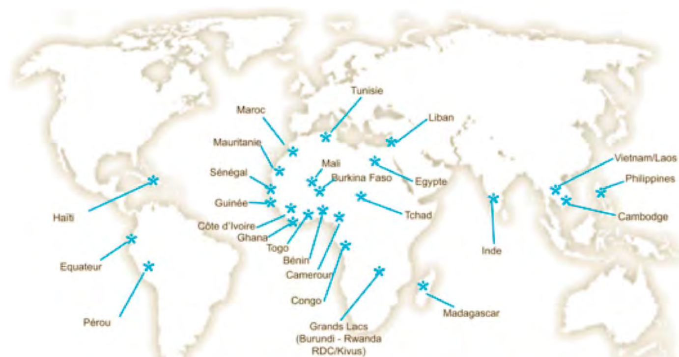
25 Espaces Volontariats dans le monde Avril 2015